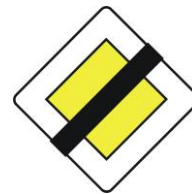
B4 - Sfârșitul drumului cu prioritate