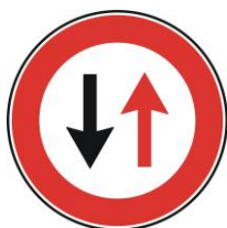
B5 - Prioritate pentru circulația din sens invers