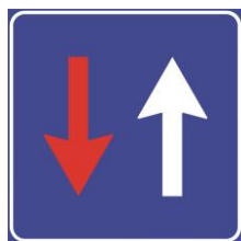
B6 - Prioritate față de circulația din sens invers