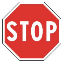
B2 - Stop