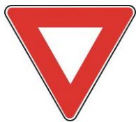
B1 - Cedează trecerea